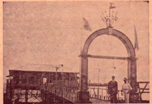
El primer edificio balneario que se construyó en Puntarenas.