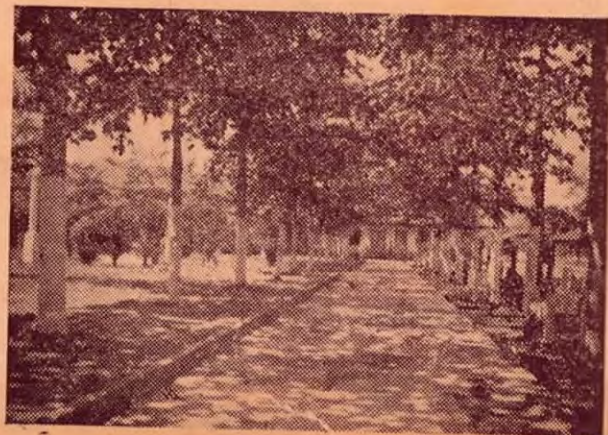
Un aspecto del Parque de Santa Cruz.