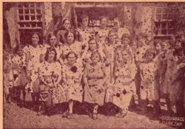
Un selecto grupo de maestras de Santa Cruz posan gentilmente para nuestra Cámara.

El cantón de Santa Cruz, cuenta con una población de más o menos 28,000 habitantes. Todos ellos empeñosos en la agricultura, en el comercio, (Concluye en nuestra próxima edición).