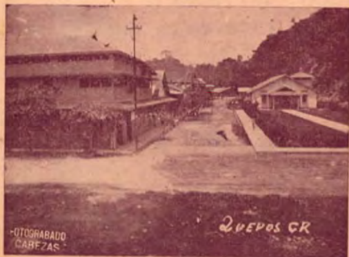
Panorámico aspecto de la calle a Rancho Grande en Quepos.

El Redactor presenció el trabajo de saneamiento y reparación de calles. Una cuadrilla está dedicada a dejar lista y bien bonita la que arranca de la esquina de la Farmacia Moreno a Rancho Grande. Bien aplanadita y suficientemente ancha está quedando. Cuando estos trabajos terminen otra se encargará de