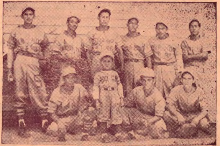
El equipo de Finca Jalaca es de Beisbol, y según nuestros informes, es uno de los más poderosos de la región. Aquí vemos su novena posando para la Revista, con su "mascotilla".

Concluimos estas disquisiciones con una expresión profunda de deseos: que nuestros anunciantes, colaboradores y nuestros lectores y sus familiares, así como todo el conjunto nacional costarricense, tenga unas FELICES NAVIDADES y un VENTUROSO AÑO NUEVO, y que al sonar las campanas tristes despidiendo al viejo, en nuestras almas haya un florecer de esperanzas y una fuerza de propósitos loables.