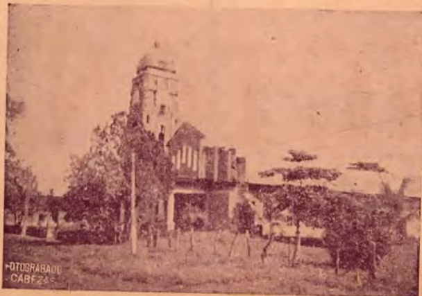
La vieja Iglesia de Santa Cruz, la cual será objeto de algunas reparaciones debido al mal estado en que quedó después de los temblores de octubre pasado.

Para ella, bella entre las bellas mujeres bajureñas de ese Guanacaste querido, el sentido homenaje de esta Revista.