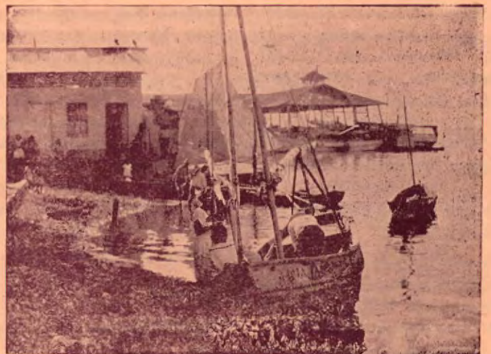
Aspecto pintoresco del estero, el muellecito ya en mal estado y el arribo de una embarcación costanera.