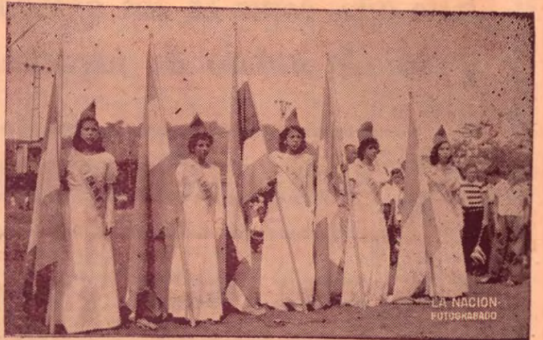
Niñas abandonadas de Golfito en las pasadas fiestas patrias del 15 de Setiembre, Día de la Independencia Nacional.